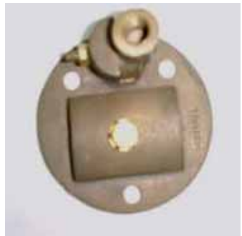
正三角形固定底座